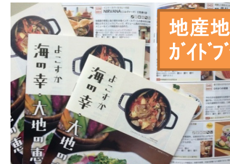
地産地消 ガイドブック

地産地消ガイドブック発行(10万部) 、“食”の展示会、大収穫祭、ゴールデン・ボンバー・コンサートへの出店等、地域産品のマッチングとPRを促進。