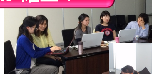
スキルアップ講座