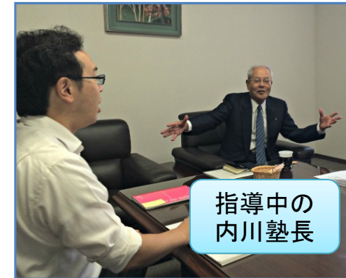
指導中の 内川塾長