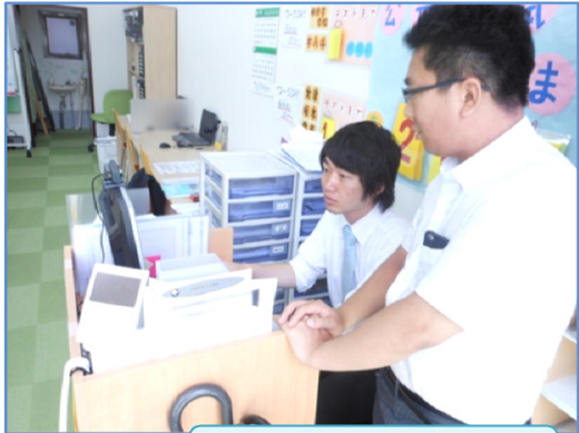
(株)スタディパーク